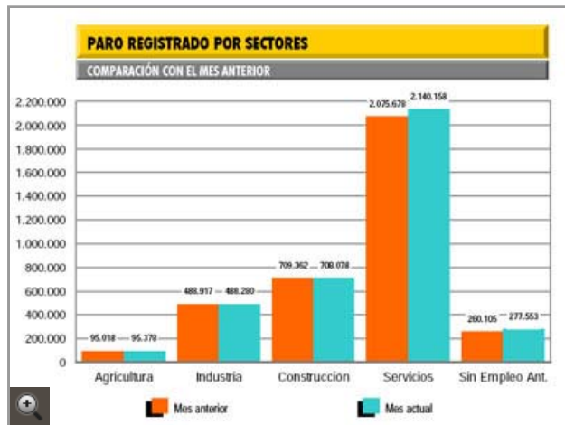
Comparación intermensual del paro según el sector de actividad económica.

El ministro sí reconoce que frente a los efectos "evidentes" de este plan en la construcción, Granado asegura que la situación en la industria es "más preocupante". También ha pesado la gripe A, añadió Granado, por el retraso en las contrataciones del sector educativo, ya que los centros han apurado más que otros años ante el posible impacto de la epidemia.