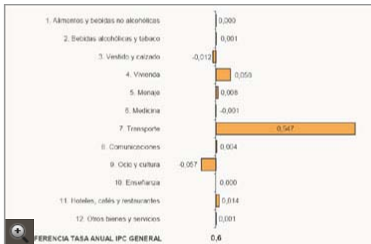
Diferencia de precios por grupos en la tasa del IPC general.

Esta tasa del -0,8%, la sexta consecutiva en valores negativos, se aleja y mucho de esos máximos cercanos que alcanzó durante el verano pasado, cuando los los precios tocaron 'techo' en julio con un IPC del 5,3%. A partir de entonces, la inflación comenzó a descender, entrando en negativo en el mes de marzo de este año.