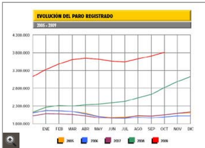
Evolución del paro registrado.

Tras la tregua concedida entre abril y julio , octubre, un mes tradicionalmente malo en términos de desempleo, registra el tercer mes consecutivo de subidas y se salda con casi 99.000 parados más apuntados a las listas del antiguo Inem, algo que, tal como se esperaba, inaugura un trimestre negro para el mercado de trabajo.