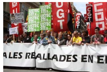
Capçalera de la manifestació que ha començat aquest dimarts a la plaça Universitat de Barcelona