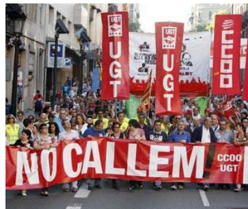
Capçalera de la manifestació que ahir a la tarda va recórrer la Via Laietana de Barcelona Foto: ORIOL DURAN.