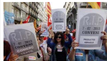
Treballadors afectats per la reforma laboral mostren pancartes anunciant la mort dels seus convenis