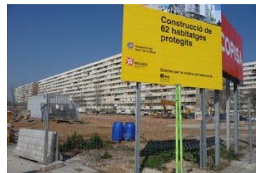
Una promoció d'habitatges protegits d'Incasol a Sant Adrià del Besòs