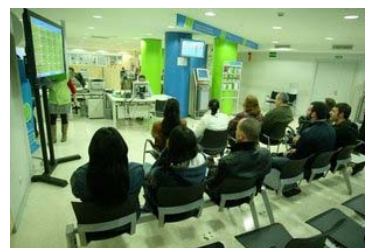
La Generalitat ha rebut en els primers tres mesos del 2012 un total de 1.428 ERO, que han afectat 20.761 treballadors